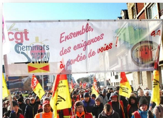
Saint Nazaire, le 07.02.2023