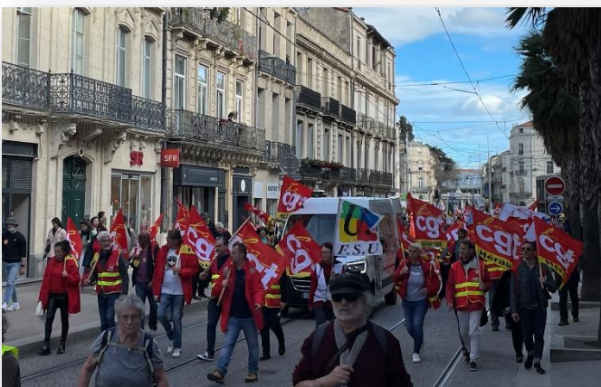
Montpellier, le 11 mars 2023.

Rejoindre la CGT, c'est débattre, proposer, revendiquer, agir et lutter collectivement.